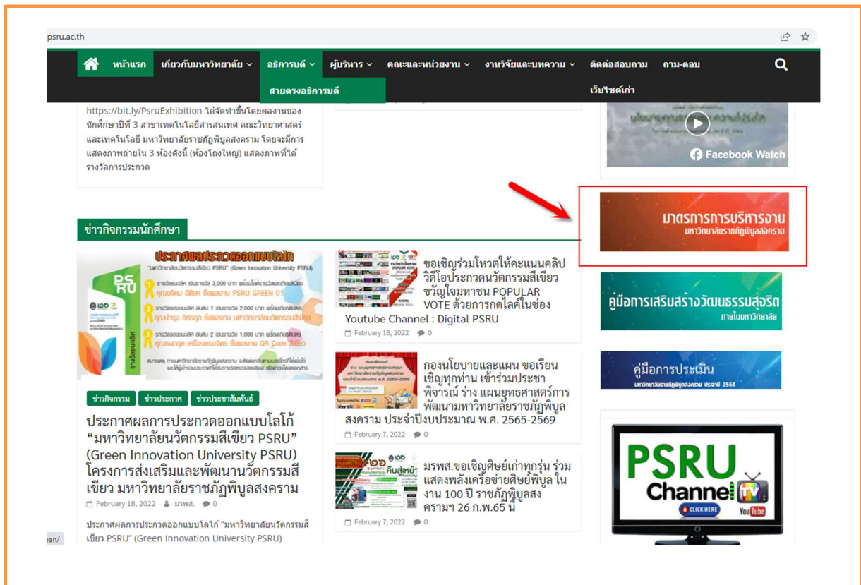
ภาพที่ 1 แสดงช่องทางการเข้าถึงมาตรการส่งเสริมคุณธรรมและความโปร่งใสภายในหน่วยงาน