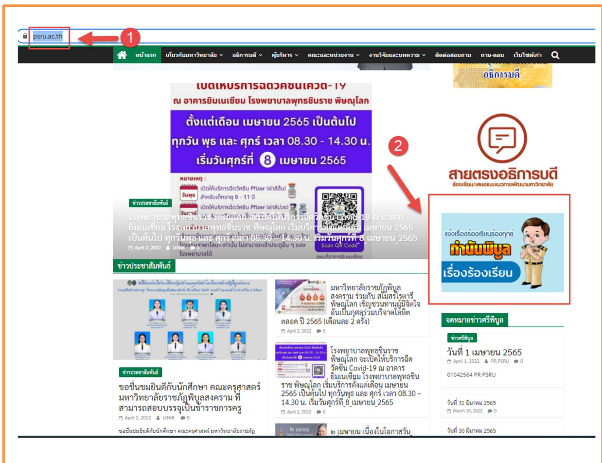
ภาพที่ 1 แสดงช่องทางออนไลน์การเข้าถึงเรื่องร้องเรียนต่าง ๆ “กำนันพิบูล”