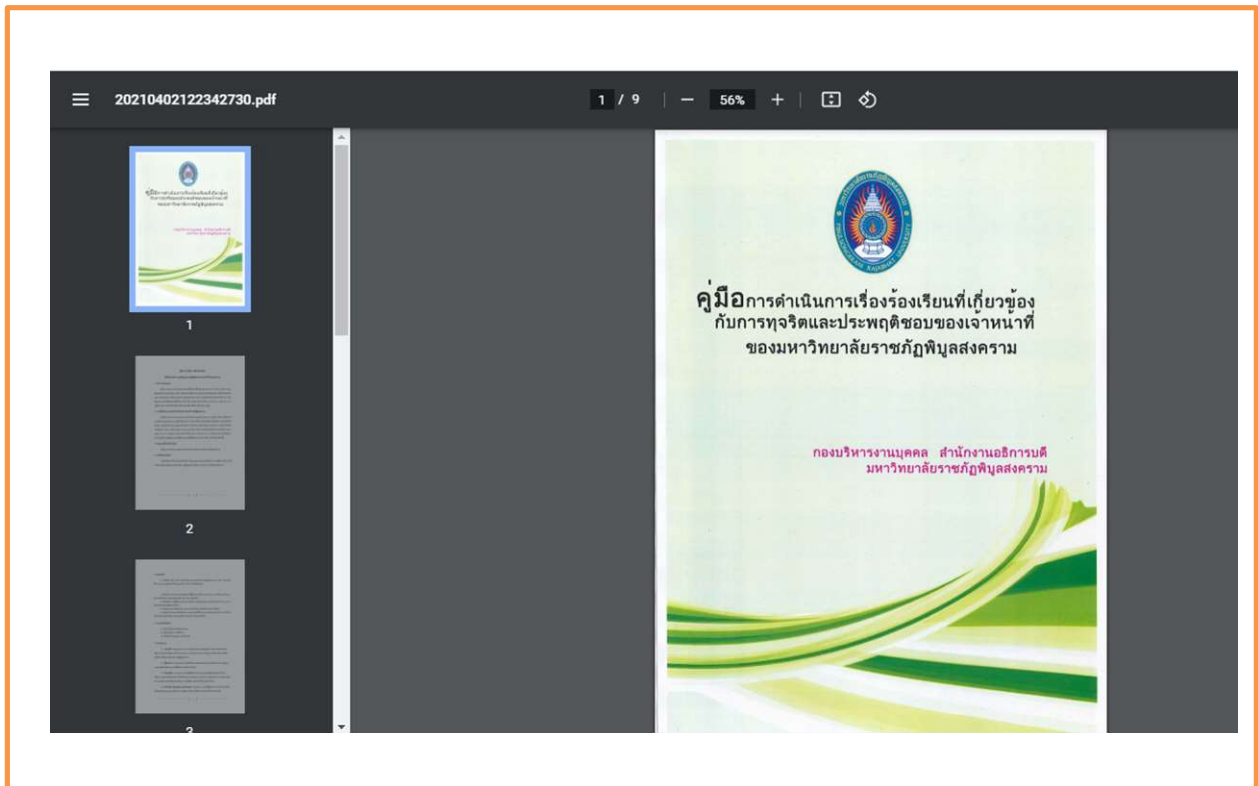
ภาพที่ 4 แสดงคู่มือการดำเนินการเรื่องร้องเรียนฯ