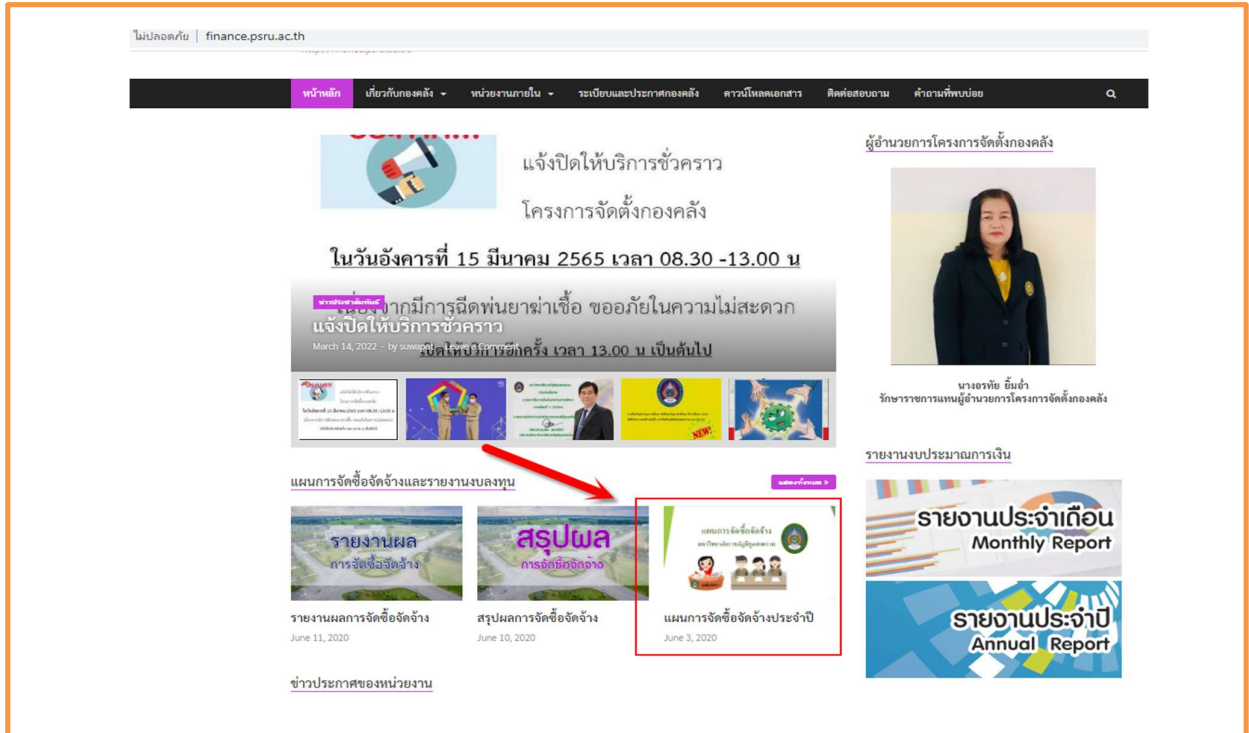
ภาพที่ 2 แสดงข้อมูลแผนการจัดซื้อจัดจ้างประจำปีงบประมาณ