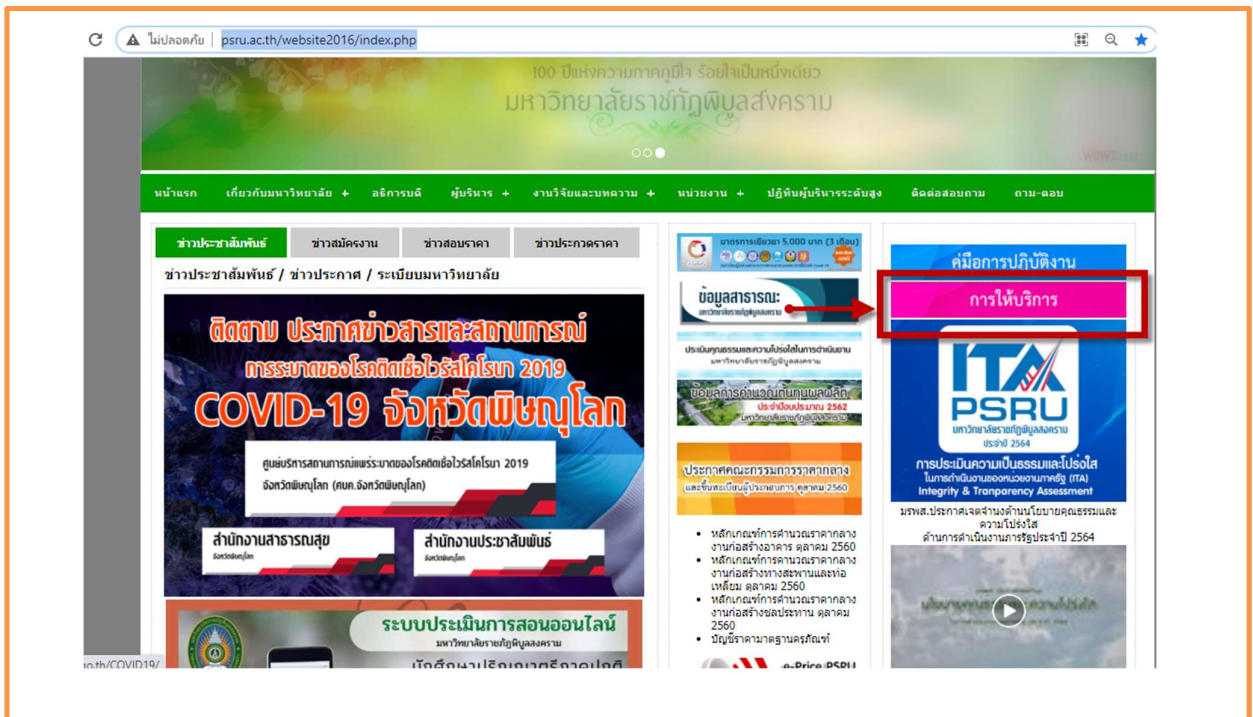
ภาพที่ 1 แสดงช่องการเข้าถึงการให้บริการ

https://plan.psru.ac.th/?wpdmpo=%E0%B8%A3%E0%B8%B2%E0%B8%A2%E0%B8%87%E0%B8%B2%E0%B8%99%E0%B8%9C%E0%B8%A5%E0%B8%81%E0%B8%B2%E0%B8%A3%E0%B8%9B%E0%B8%A3%E0%B8%B0%E0%B9%80%E0%B8%A1%E0%B8%B4%E0%B8%99%E0%B8%84%E0%B8%A7%E0%B8%B2%E0%B8%A1 ดังรูป