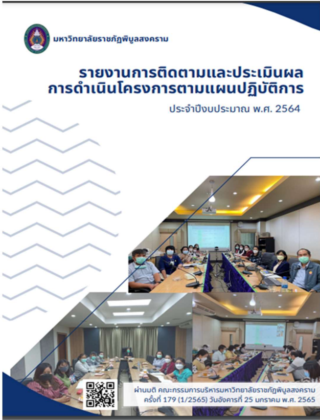
ภาพที่ 3 แสดงข้อมูลรายงานผลการดำเนินงานประจำปี 2564

แบบฟอร์มแผนการใช้จากแหล่งงบประมาณทั้งหมดปี ประจำปีงบประมาณ พ.ศ.2564 →