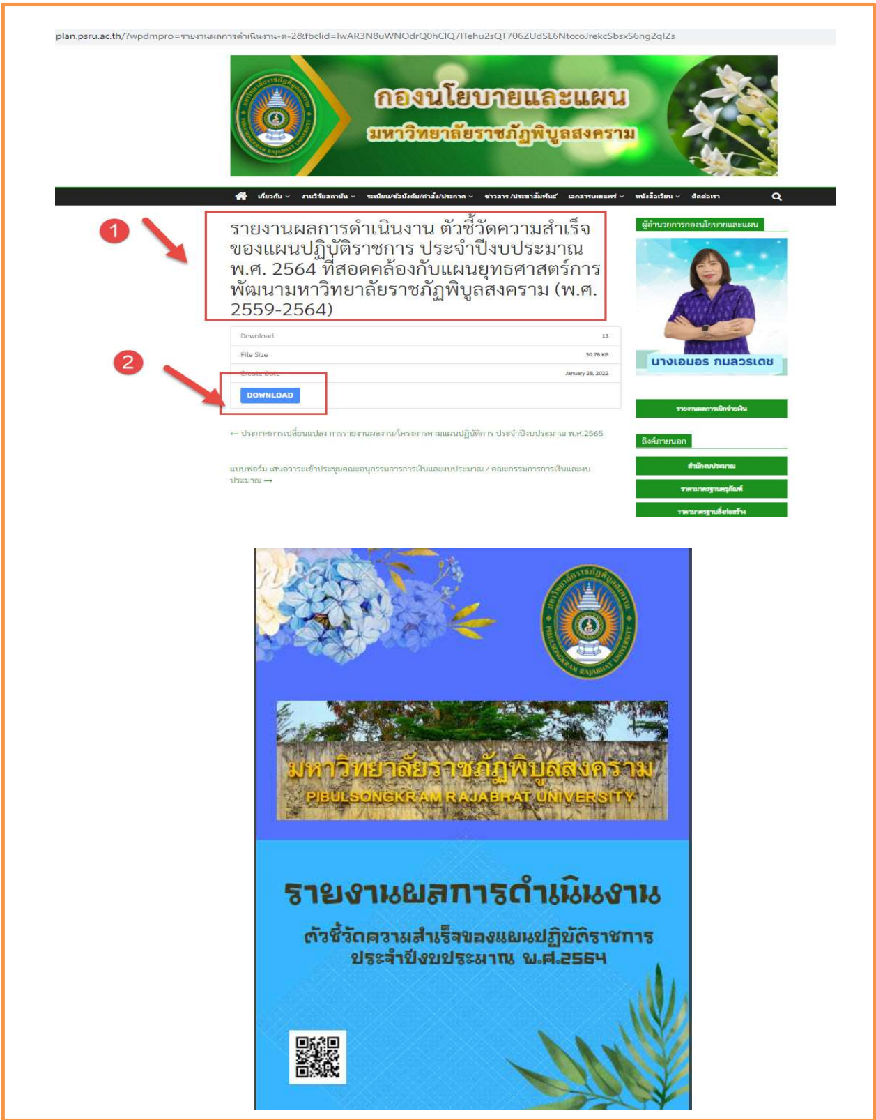
ภาพที่ 2 แสดงข้อมูลรายงานผลการดำเนินงานประจำปี งบประมาณ พ.ศ. 2564