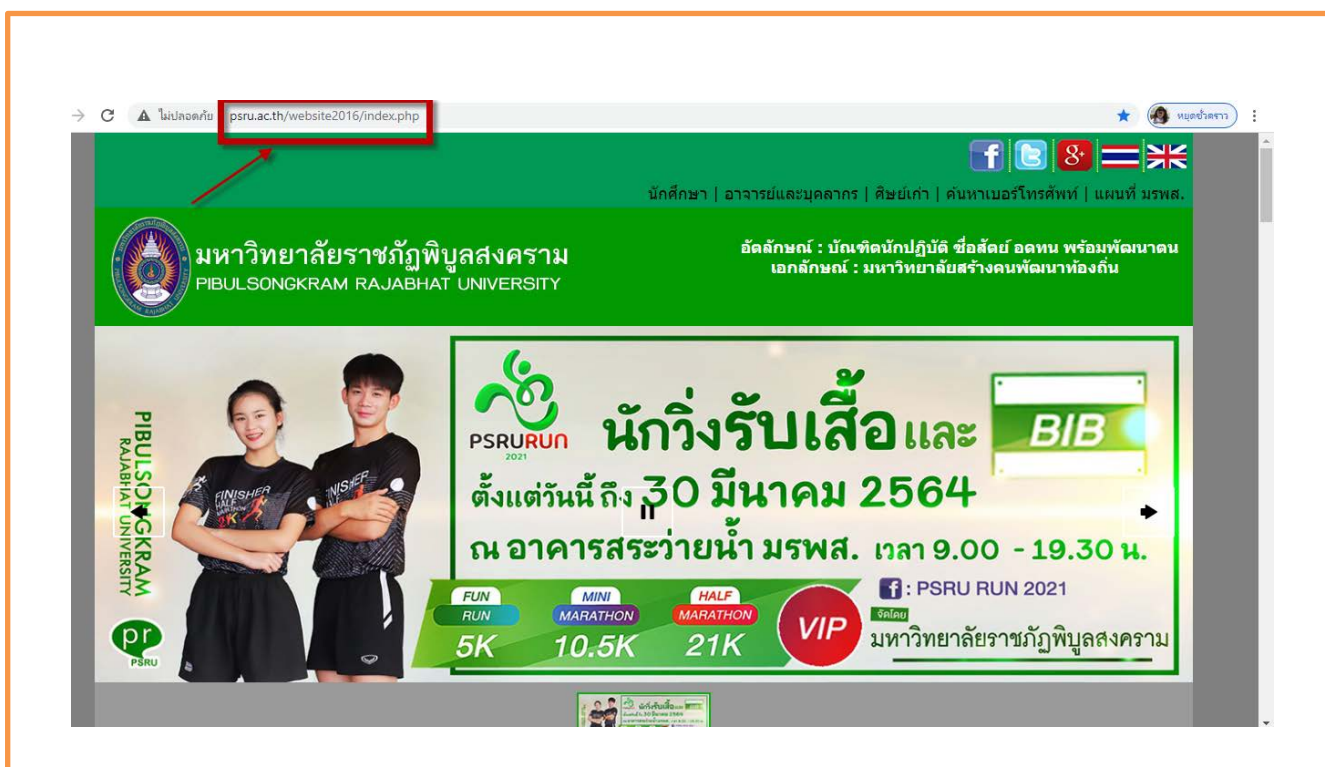
ภาพที่ 1 แสดงที่อยู่เว็บไซต์หลักของมหาวิทยาลัยราชภัฏพิบูลสงคราม http://www.psu.ac.th/

ซึ่งปรากฏข้อมูลดังกล่าวบนเว็บไซต์ของมหาวิทยาลัยฯ http://www.psu.ac.th/ ดังนี้