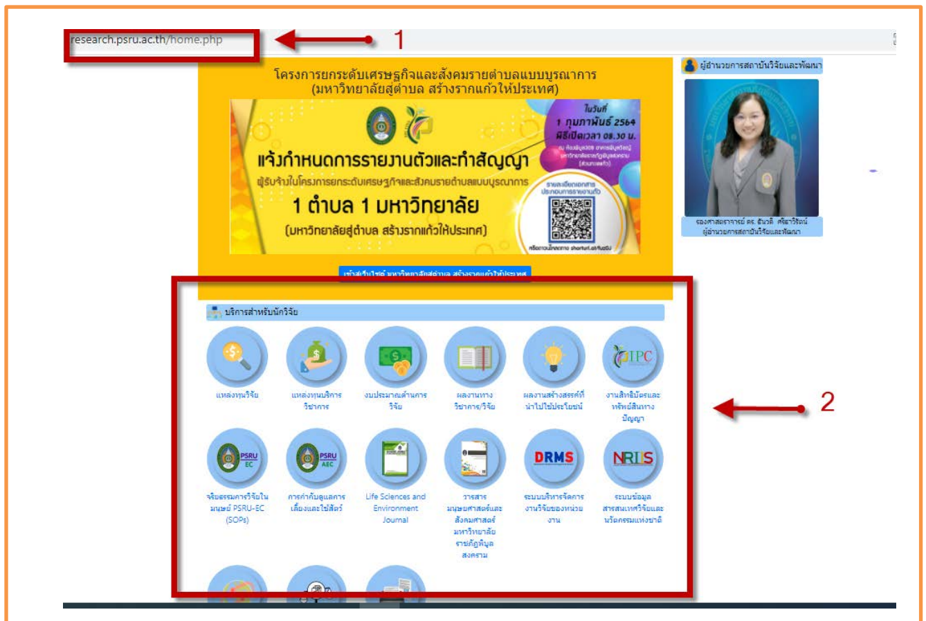
ภาพที่ 4 แสดงช่องทางการเผยแพร่ด้านการวิจัยและบริการวิชาการ

ช่องทางการเข้าถึงการประชาสัมพันธ์ข้อมูลข่าวสาร ด้านการวิจัย และบริการ วิชาการ https://research.psu.ac.th/home.php