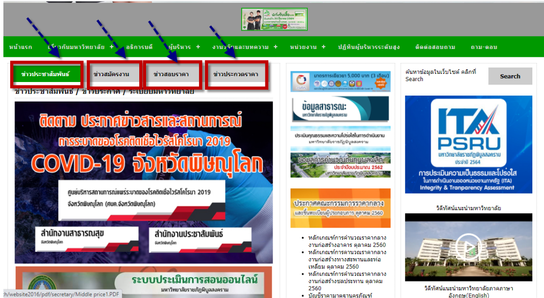
ภาพที่ 2 แสดงช่องทางการเผยแพร่ข้อมูลข่าวสารแต่การดำเนินงานต่าง ๆ