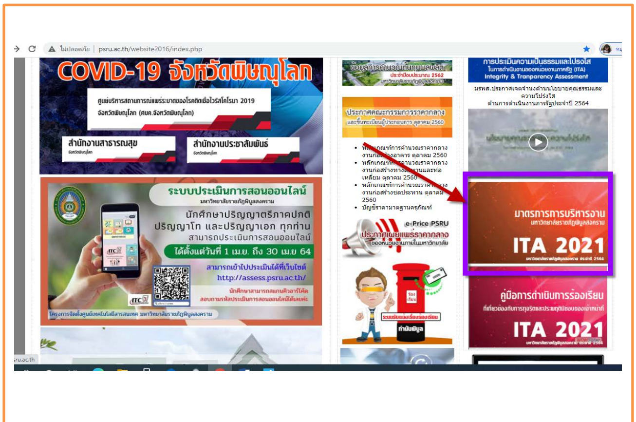
ภาพที่ 1 แสดงช่องทางการเข้าถึงการดำเนินการตามมาตรการการบริหารงาน

การเข้าถึงข้อมูลบนเว็บไซต์ มหาวิทยาลัยราชภัฏพิบูลสงคราม ได้มีการแสดงผลการดำเนินการตามมาตรการส่งเสริมคุณธรรมและความโปร่งใสภายในหน่วยงาน เป็นต้น โดยสามารถเข้าได้ที่เว็บไซต์หลักของมหาวิทยาลัย http://www.psu.ac.th เมนู มาตรการการบริหารงาน http://www.psu.ac.th/website2016/psru_file/index_measure.php หัวข้อ การดำเนินการตามมาตรการส่งเสริมคุณธรรมและความโปร่งใสภายในหน่วยงาน http://audit.psu.ac.th/transparency.html?fbclid=IwAR0z3J1TTXjzadmle0O9P_I9C72pHewyFuKrTaB45R-ZT960cMumcgv-OSM ดังรูป