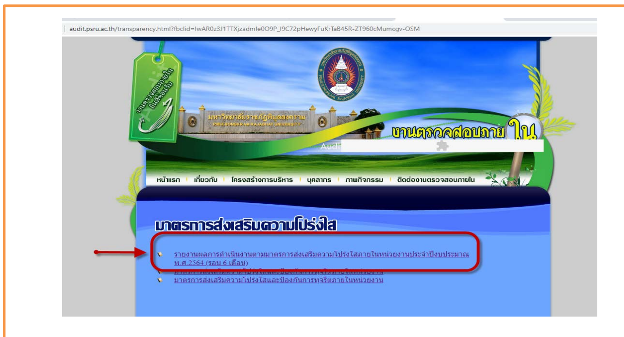
ภาพที่ 3 แสดงช่องทางการรายงานผลการดำเนินงาน