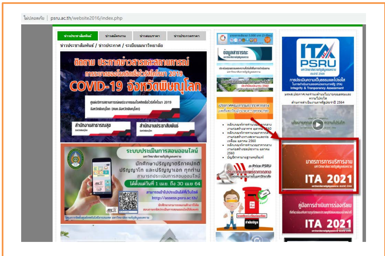
ภาพที่ 1 แสดงช่องทางการเข้าถึงมาตรการการบริหารงาน

http://www.psu.ac.th/website2016/psru_file/index_measure.php ดังรูป