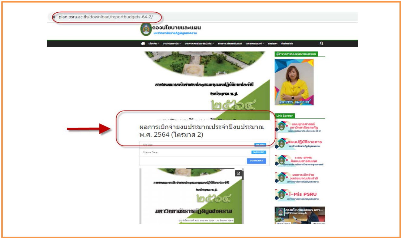
ภาพที่ 2 แสดงข้อมูลผลการเบิกจ่ายงบประมาณประจำปีงบประมาณ พ.ศ. 2564 (ไตรมาส 2)