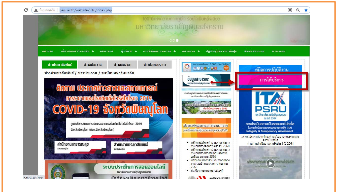
ภาพที่ 1 แสดงช่องการเข้าถึงการให้บริการ

การเข้าถึงข้อมูลบนเว็บไซต์ มหาวิทยาลัยราชภัฏพิบูลสงคราม มีการรายงานผลการสำรวจความพึงพอใจในการให้บริการ ไว้ที่หน้าเว็บไซต์ของมหาวิทยาลัยฯ http://www.psu.ac.th/website2016/index.php โดยสามารถเข้าได้ที่เมนู การให้บริการ http://www.psu.ac.th/website2016/psru_file/index_service.php ดังรูป