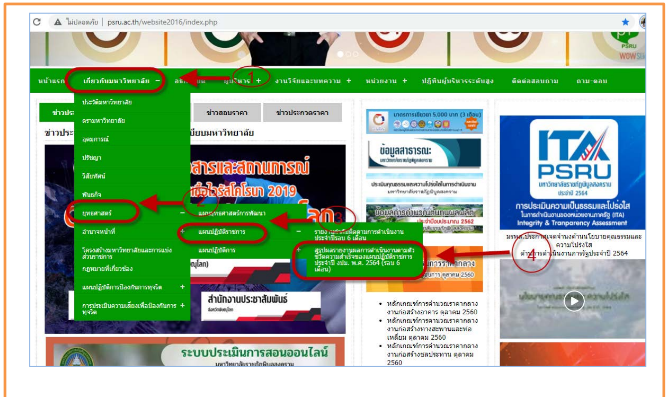
ภาพที่ 1 แสดงช่องการเข้าถึงรายงานการกำกับติดตามการดำเนินงานประจำปี รอบ 6 เดือน

การเข้าถึงข้อมูลบนเว็บไซต์ http://www.psu.ac.th มหาวิทยาลัยราชภัฏพิบูลสงคราม มีการเผยแพร่ความก้าวหน้าตามแผนการดำเนินงานประจำปี งบประมาณ พ.ศ. 2564 โดยสามารถเข้าได้ที่เมนู เกี่ยวกับมหาวิทยาลัย เมนูย่อย ยุทธศาสตร์ และเมนู แผนปฏิบัติการ หัวข้อเมนูย่อย สรุปรายงานผลการดำเนินงาน ตัวชี้วัดความสำเร็จของแผนปฏิบัติการ ประจำปีงบประมาณ พ.ศ. 2564 (รอบ 6 เดือน) https://plan.psu.ac.th/download/reportplanpsru2564-6/ ดังรูป